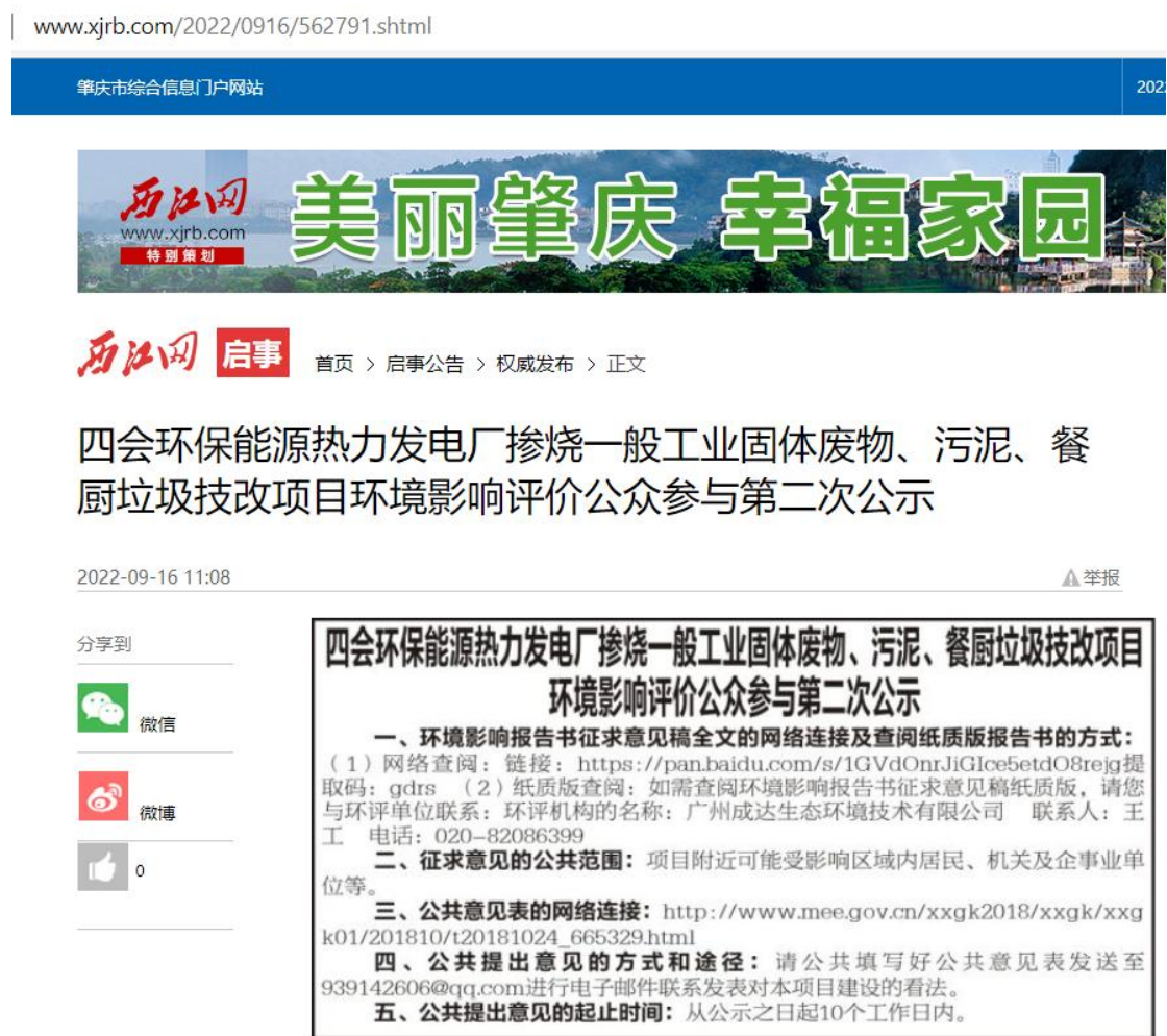
图 3.2-1 (a) 征求意见稿网上公示截图