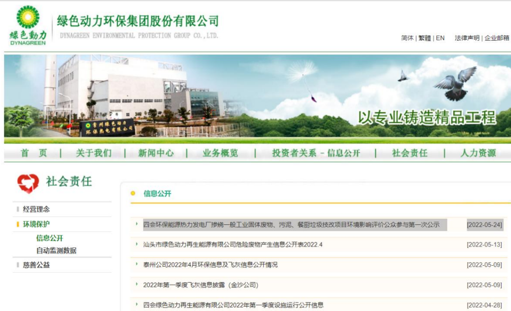
图 2.2-1 项目第一次网上公示截图