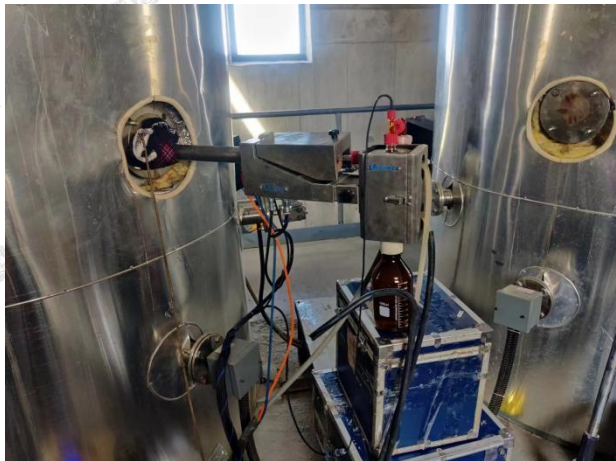
◎废气(有组织)采样点 - 1#废气排放口